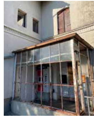
Die Gemeinde hat das Gebäude gekauft und somit nun die Möglichkeit, mittelfristig das Gelände rund um den Bahnhof zu gestalten.