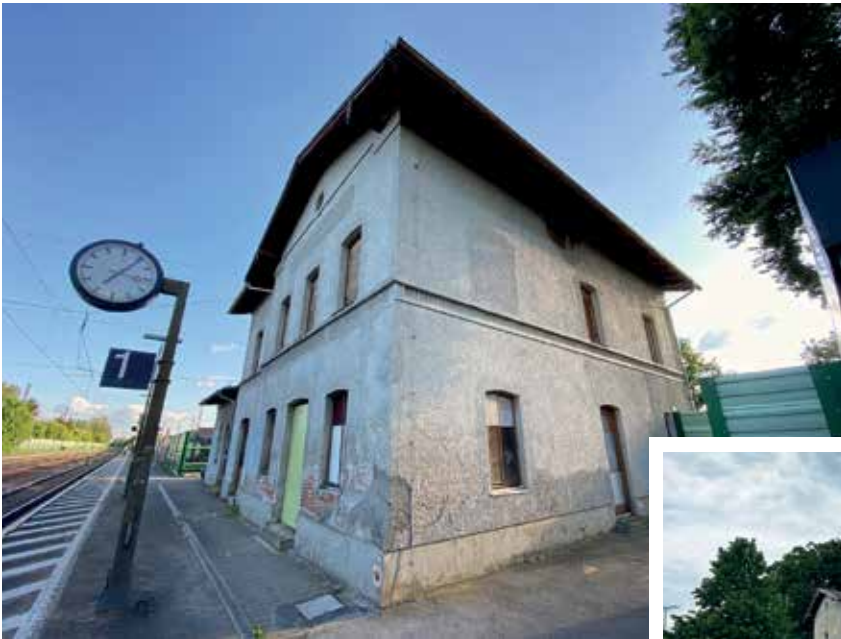
Kein schöner Anblick, wenn man in Nordendorf ankommt. Leider wäre der Zeitpunkt für eine Sanierung des Schandflecks schon vor vielen Jahren gewesen.

Der Gemeinderat hat sich nach langen, ausführlichen Diskussionen, Besichtigungen und der Einholung von Informationen mehrheitlich für den Erwerb des ehemaligen Bahnhofsgebäudes entschieden. Bereits 2002 und 2012 wurde es der Gemeinde zum Kauf angeboten, ein Kauf jedoch abgelehnt.