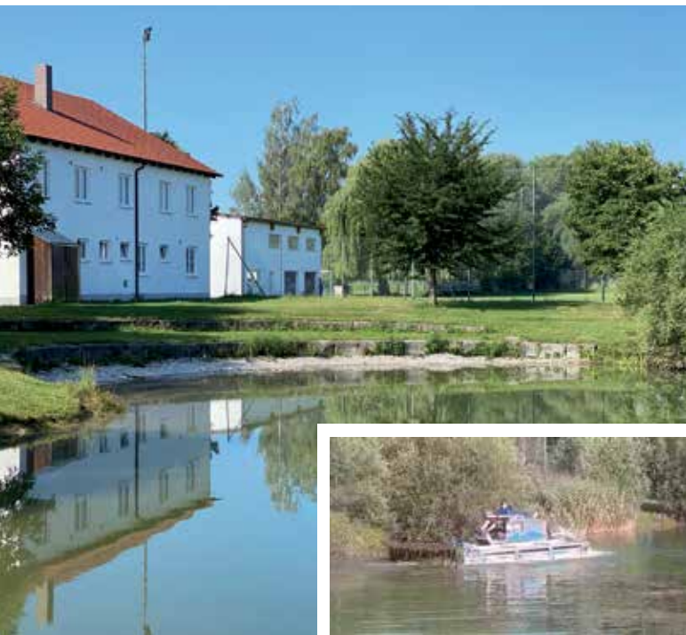
In unserem Badensee wachsen in diesem Jahr besonders stark Pflanzen im Wasser. Ein Mähboot hat nun eine effektive Lösung gebracht.