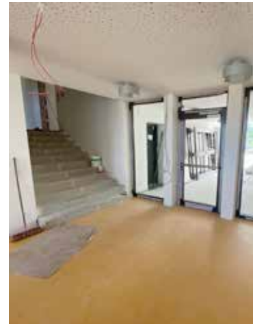
Diese Einblicke in unsere Baustelle entstanden von Juni bis Anfang August.