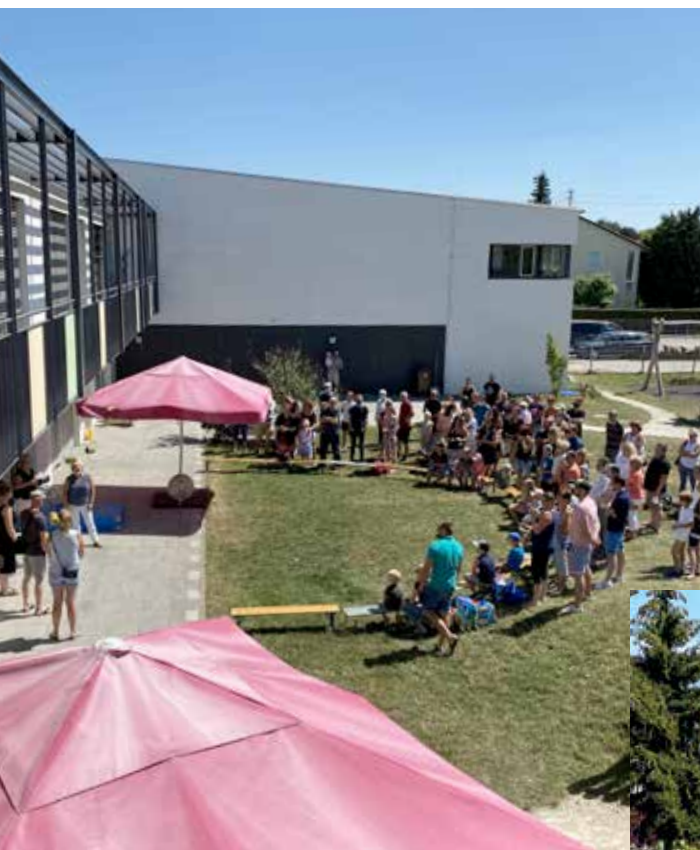
Gleich geht's in die Ferien für unsere künftigen ABC-Schützen.

Auch wenn sich öffentlich noch nicht viel tut. Im Hintergrund wird nichtsdestotrotz fleißig gearbeitet.