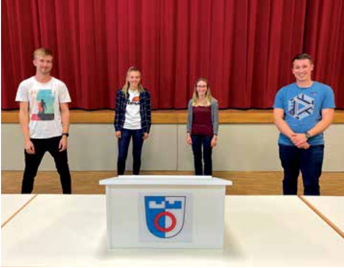
Unsere neuen Ansprechpartner für die Jugend.