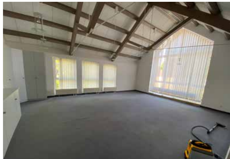
Der künftige Sitzungssaal des Gemeinderats

Der Umzug des Bürgermeisterbüros und des Sitzungssaals für den Gemeinderat wird aktuell in der zweiten Jahreshälfte vorgesehen.