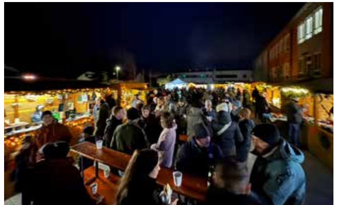
Ein voller Schulhof beim 2. Weihnachtlichen Handwerkermarkt.

Zum zweiten Mal wurde unser Schulhof zu einem Weihnachtsmarkt. Unter der Federführung der Ugandahilfe Nordendorf mit tatkräftiger Unterstützung der Bürenschützen Nordendorf, der Freiwilligen Feuerwehr Nordendorf und des Sportvereins Nordendorf konnten am 22. und 23. November hunderte Besucher aus Nah und Fern begrüßt werden.