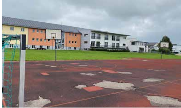
Der Schulsportplatz im Herbst 2023

Die Fläche wird vorrangig von der Schule genutzt. Nach Schulschluss (Ende der offenen Ganztagschule ist um 16:00 Uhr) kann die Fläche auch von der Öffentlichkeit genutzt werden. Bitte beachten Sie das ausgehängte Regelwerk im Schaukasten.