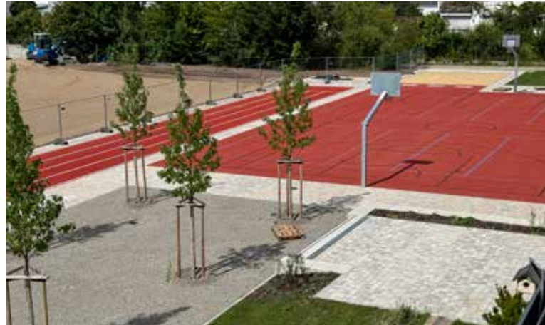
Der aktuelle Stand im August 2024