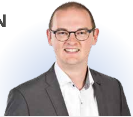
TOBIAS KUNZ ERSTER BÜRGERMEISTER