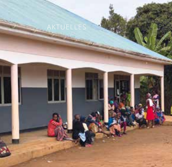
An einem extra organisierten „Gesundheitstag“ kamen auch Fachärzte aus der Region. Der Andrang war sehr groß.