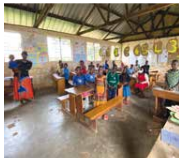
Schulbesuch der Grundschule St. Denis in Nkasi ...