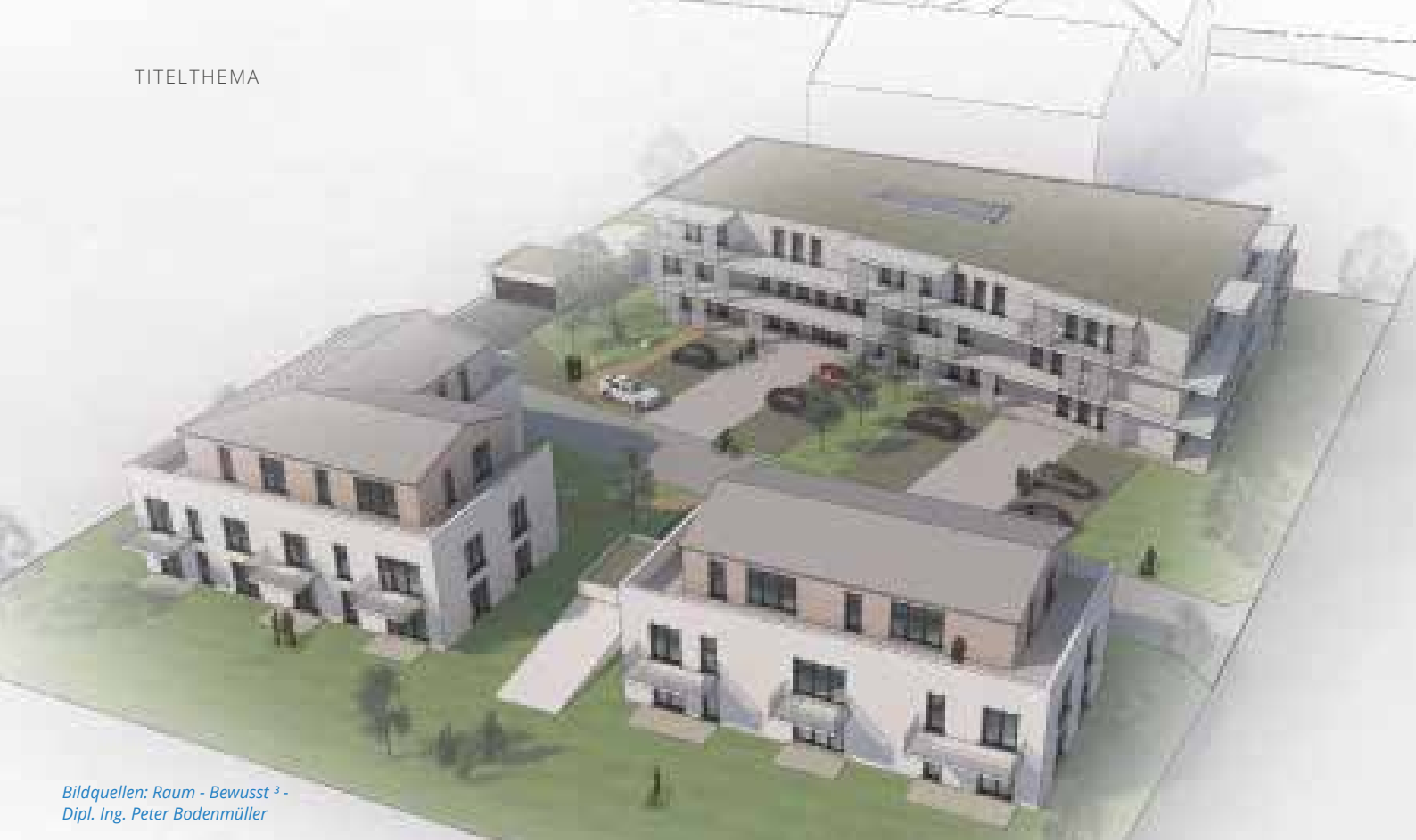
Bildquellen: Raum - Bewusst 3 - Dipl. Ing. Peter Bodenmüller

stehen.“ Zur Verkehrsberuhigung entstehen zwei Tiefgaragen. Das Hauptgebäude besticht durch seine kurvenförmige Außenfassade. Der Gemeinde war es wichtig, dass die Nachhaltigkeit einen Platz in diesem Projekt bekommt. So wird zum Beispiel eine Regenwassergewinnung für erheblich weniger Trinkwasserverbrauch sorgen. Weitere Details werden nun zwischen dem Bauträger und dem Gemeinderat entwickelt, sodass ein erster Entwurf des Bebauungs-