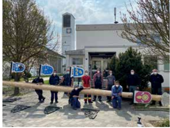
Das Team der Freiwilligen Feuerwehr beim Maibaum-Aufstellen. Das Blankenburger Exemplar (dieses Jahr eine schöne Birke) ist auf der Rückseite zu sehen.